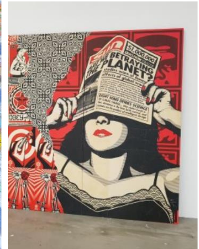
A droite, œuvre de Shepard Fairey 'Obey'